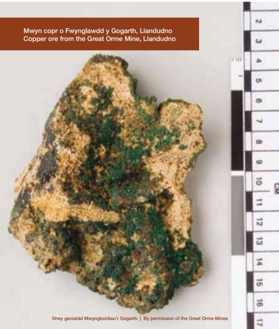
Mwyn copr o Fwynglawdd y Gogarth, Llandudno Copper ore from the Great Orme Mine, Llandudno