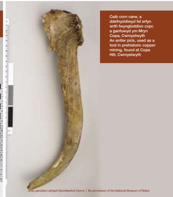
Caib corn carw, a ddefnyddiwyd fel erfyn wrth fwyngloddio copr, a ganfuwyd ym Mryn Copa, Cwmystwyth An antler pick, used as a tool in prehistoric copper mining, found at Copa Hill, Cwmystwyth