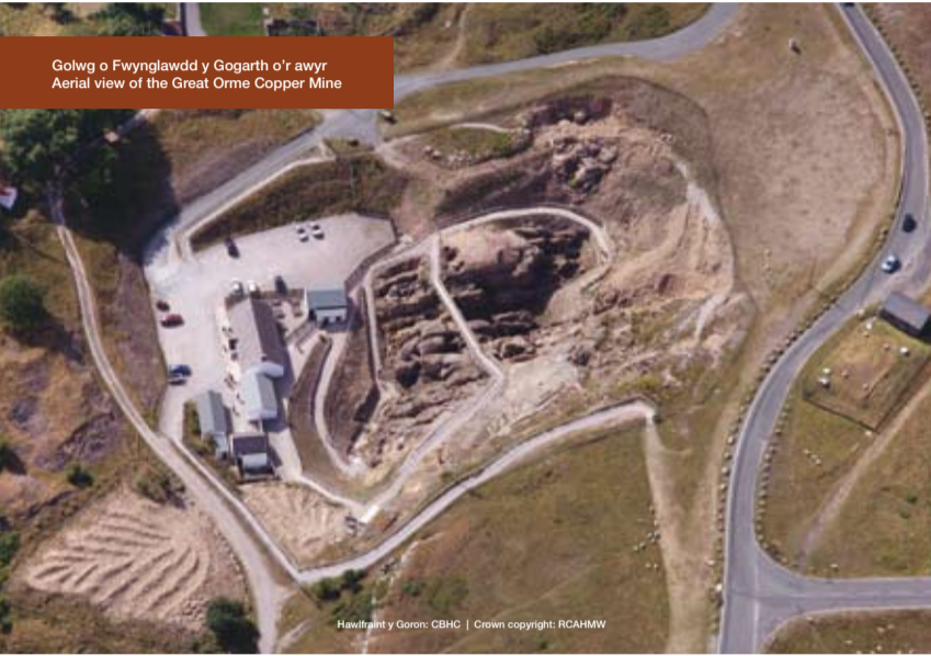
Golwg o Fwynglawdd y Gogarth o'r awyr Aerial view of the Great Orme Copper Mine