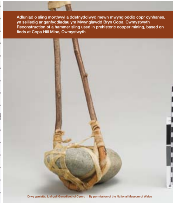
Adluniad o sling morthwyl a ddefnyddiwyd mewn mwyngloddio copr cynhanes, yn seiliedig ar ganfyddiadau ym Mwynglawdd Bryn Copa, Cwmystwyth Reconstruction of a hammer sling used in prehistoric copper mining, based on finds at Copa Hill Mine, Cwmystwyth